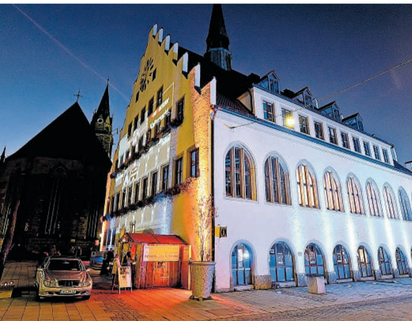
Das Rathaus illuminiert: Es bildete den Mittelpunkt der Kulturnacht 2011, magisch angestrahlt und geheimnisvoll.