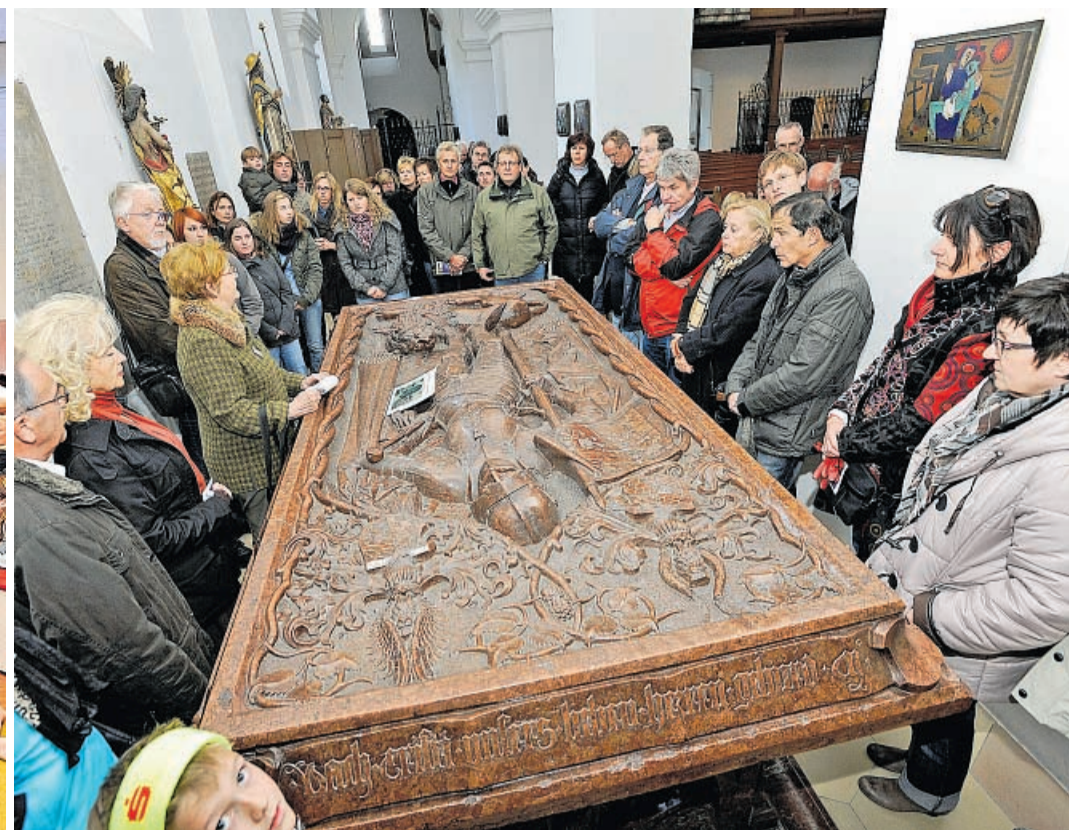
Im Rathaussaal sind normalerweise höchstens Wort-Akrobaten bei den diversen Sitzungen am Werk. In der Kulturnacht eroberten die Artisten des Circusvereins den Sitzungssaal (linkes Bild). Groß war das Interesse am Pfalzgrafengrab in der Hofkirche: Hier erfuhren die Zuhörer, was dem geharnischten Otto II. von Moosbach zu seinen Lebzeiten so alles widerfahren ist (rechtes Bild).